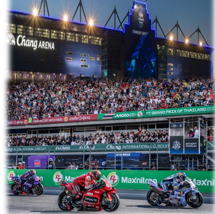
Chang ARENA MotoGP PT GRAND PRIX OF THAILAND 2026 Maxnitree