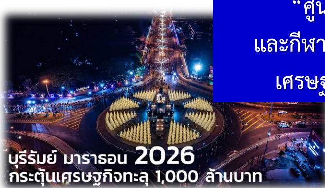
บุรีรัมย์ มารารอน 2026 กระตุ้นเศรษฐกิจทะลุ 1,000 ล้านบาท