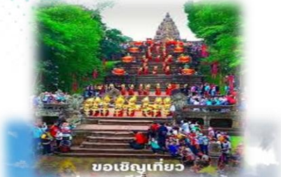
ขอเชิญเที่ยว

“ศูนย์กลางการท่องเที่ยวอารยธรรมขอม และกีฬามาตรฐานโลก มหานครแห่งความรื่นรมย์ เศรษฐกิจมั่นคง คู่สังคมเข้มแข็งอย่างยั่งยืน”